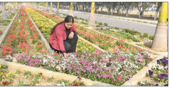
रोहताक। पुष्प सज्जा को देखती छात्रा।

हरिभूमि न्यूज महम मानसूनी सीजन में हुई तेज बरसात की वजह से हुए जलभराव के चलते सैमाण गांव की सैकड़ों एकड़ कृषि भूमि बिना बिजाई के खाली रह गई है। गेहूं, चना और अन्य फसलों की बिजाई नहीं हो पाई। खेतों में पानी भरा हुआ है या फिर दलदल की स्थिति है। किसान फसल की बिजाई न होने की वजह से सरकार से खाली जमीन के मुआवजे की मांग कर रहे हैं। मुआवजा लेने के लिए वे क्षतिपूर्ति पोर्टल पर ब्यौरा अपलोड करना चाहते हैं। लेकिन क्षतिपूर्ति पोर्टल बंद होने ने खेतों की गिरावटी करवाई जाने की वजह से वे जमीन का ब्यौरा अपलोड