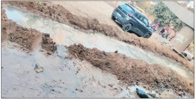
रोहताक। निर्माणाधीन पुल के पास बहाता हुआ पानी।

स्थानीय निवासियों का कहना है कि पिछले कई दिनों से पानी की गुणवत्ता बेहद खराब है। कई घरों में नल खोलते ही दुर्गंध फैल जाती है, वहीं कुछ स्थानों पर पानी में मिट्टी और गंदगी साफ दिखाई देती है। इस दूषित पानी से बीमारियों का खतरा भी मंडरा रहा है, खासकर बच्चों और बुजुर्गों के स्वास्थ्य को लेकर लोग चिंतित हैं। लोगों ने जन स्वास्थ्य विभाग से समस्या के समाधान की मांग की है।