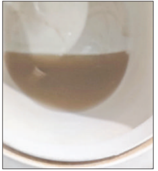
रोहताक। लादौत रोड पर ऐसा आ रहा पानी।